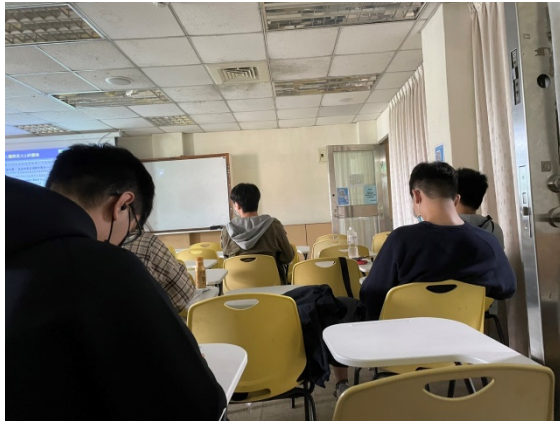
聽講情形，即使很疲勞仍為新增知識而努力與瞌睡蟲奮鬥的同學們