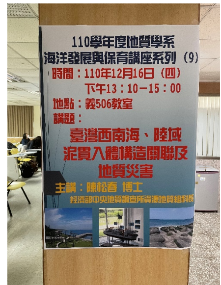
本次講座海報張貼於 506 教室外