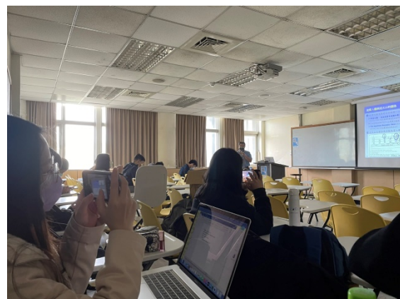
聽講情形，認真記錄講座內容、寫筆記的同學們