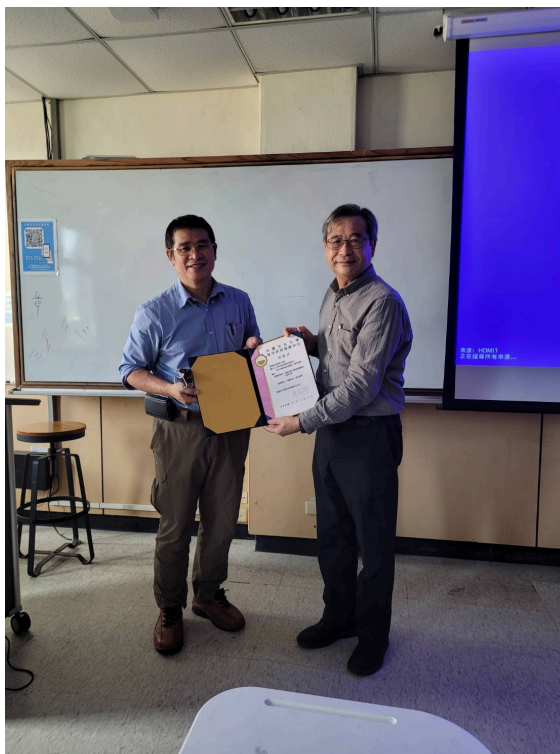
院長為老師頒發感謝狀，以表對老師不辭辛勞地為同學帶來收穫的感謝及喜悅