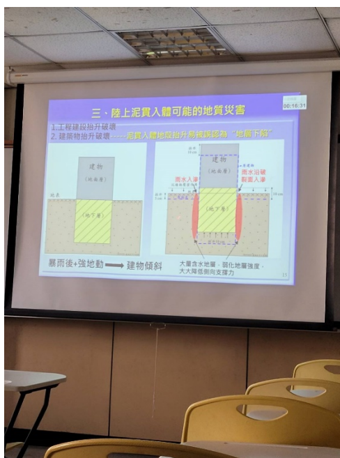
主講情形，用圖表介紹陸上泥貫入體的災害情況